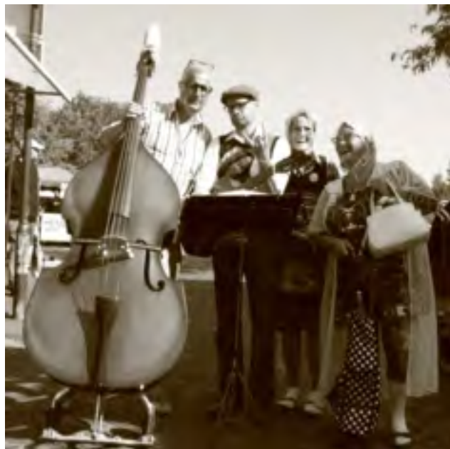
Nee hê? Ook dat nog!