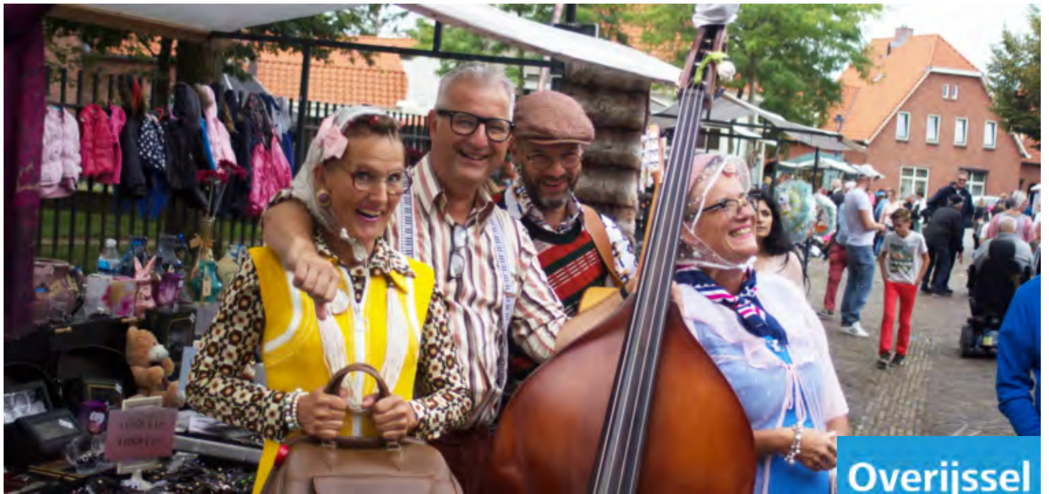
De band Nee hè, ook dat nog! treedt op bij Talent in Huis op 4 oktober