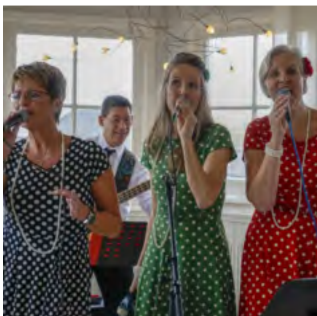
Ranja en de Rietjes

Met basgitaar, toetsen, drums, gitaar en veel meerstemmige zang speelt de Twentse band Ransom een breed jaren 70 en 80-repertoire. Ze rocken van de Eagles tot Stevie Wonder en van de Beatles naar Hazes. Ze geven 3 knallende optredens!