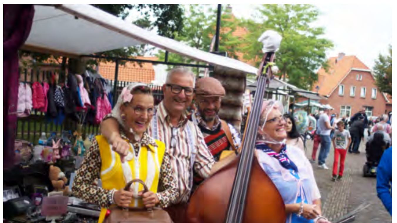
De band Nee hè, ook dat nog!

Teksten: Quinta Clason, Harry Moek Ontwerp: Provicom/provincie Overijssel