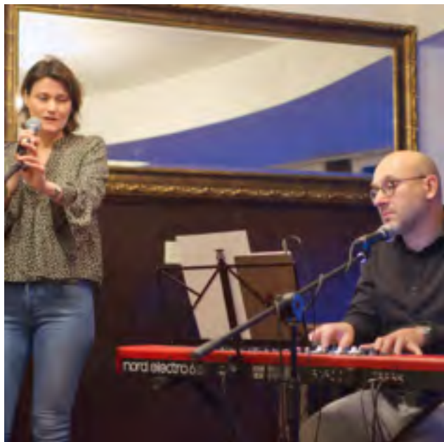
'Easy listening' van MooCh